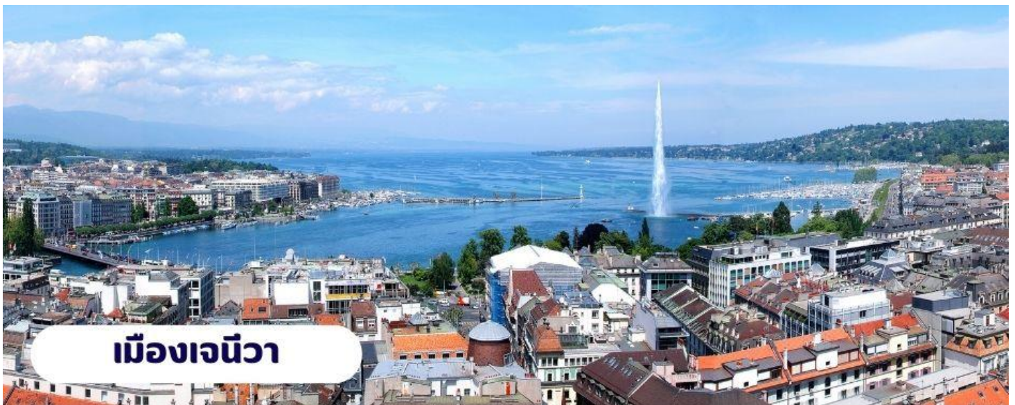
เมืองเจนีวา